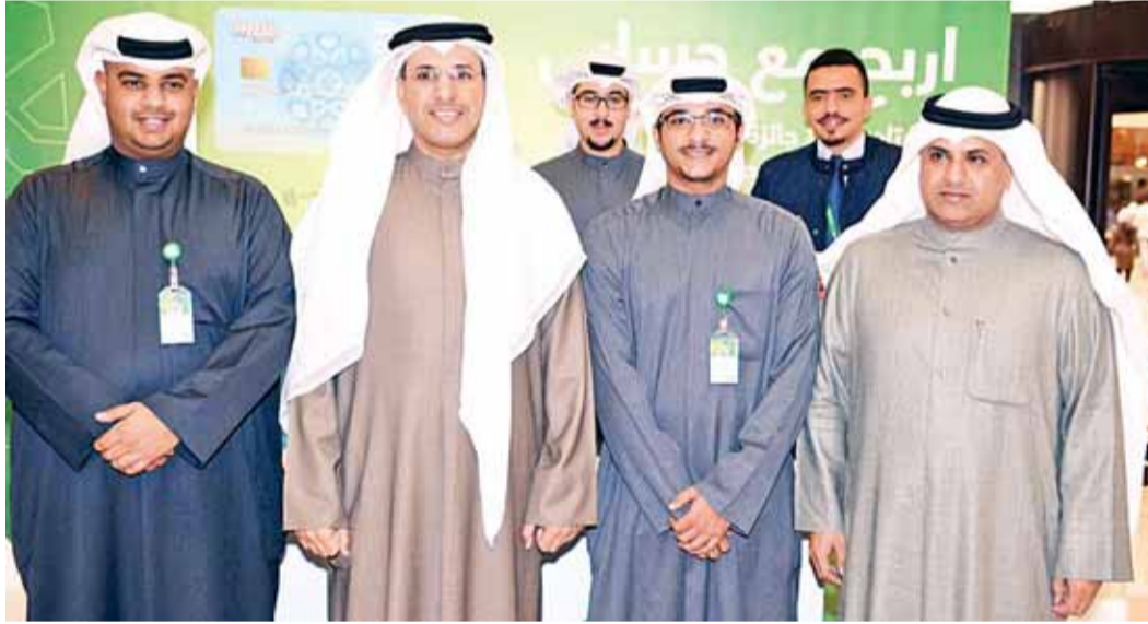
جانبا من مشاركة «بيتك» في المعرض

ولقي جناح «بيتك» إقبالا كبيرا من زوار المعرض من الطلبة والإساتذة، وتركت الأئسلة والاستفسارات عن طبيعة عمل «بيتك» ومساهماته الاقتصادية، وخدماته ومنتجاته المختلفة، بالإضافة إلى أنشطته المتنوعة.