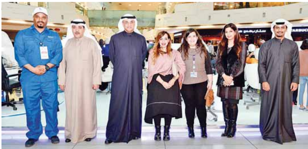
الفيلج يتوسط فريق «زين» خلال الفعالية

العديدة، وخاصة تلك التي تعمل على نشر وتشجيع استخدام اللغة العربية. وأكدت الشركة اهتمامها بدعم ومساندة الجهات التي تقدم البيئة المناسبة للأجيال القادمة وفق أعلى المعايير العالمية، حيث لن تذخر الشركة جهداً في تقديم المساندة والدعم لكل جهة تملك فكرة ورؤية تتماشى الإبداع وتخدم المجتمع وتُسهم في رفعة الوطن.