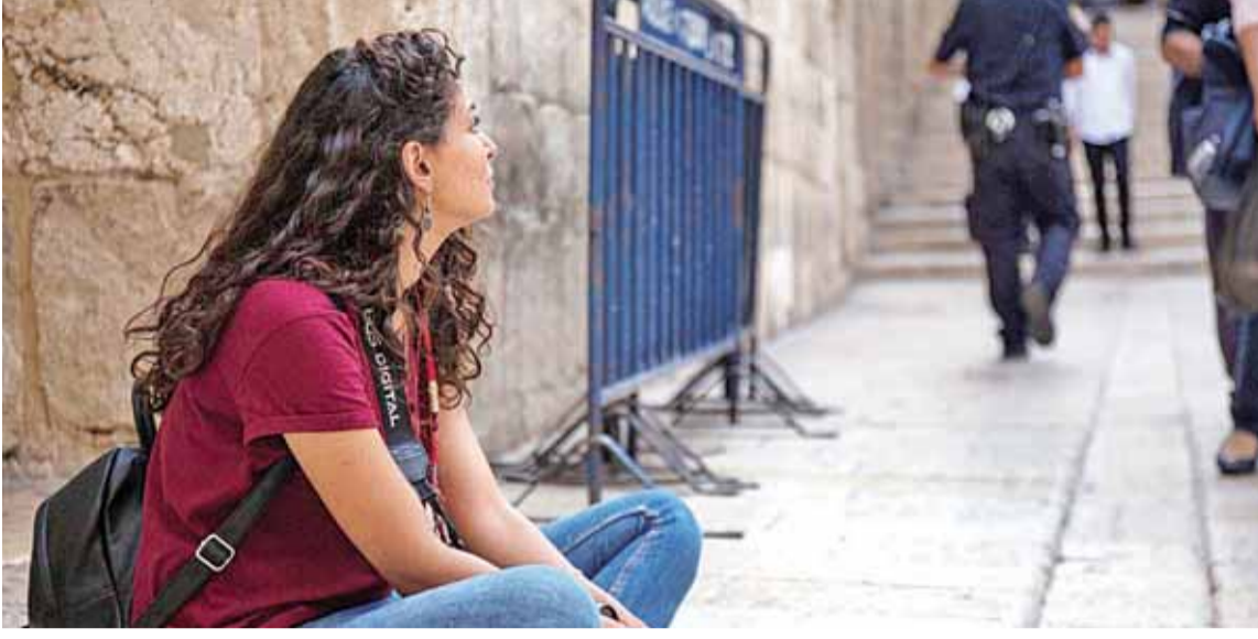
من فيلم "وعد"