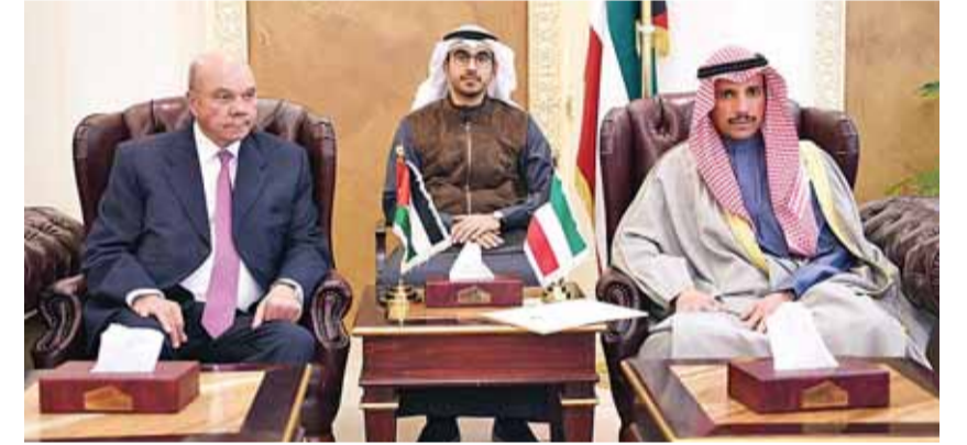
الغانم خلال مباحثاته مع الفايز أكونا

انطلقت أمس الاحتفالات الشعبية بالأعياد الوطنية والأنشطة المصاحبة في ساحة العلم بمركز الشيخ جابر الأحمد الثقافي تحت رعاية سمو رئيس الوزراء الشيخ جابر المبارك. وأكد نائب رئيس مجلس الوزراء وزير الخارجية الشيخ صباح الخالد، ممثلاً رئيس الوزراء، الدور الكبير لسمو الأمير وجهوده الرسمية إلى تكريس الأمن والاستقرار في ظل الفترة العصيبة التي تمر بها المنطقة. وقال الخالد إن الكويت حققت إنجازات كبيرة في عهد سمو الأمير، في ظل رعايته المباشرة وخبرته الطويلة التي سخرها لخدمة الأمن والاستقرار والحياة الكريمة التي امتدت لتشمل دول العالم أجمع. ورفع أسمى آيات الشهاني والتبريكات إلى مقام سمو الأمير، بمناسبة رفع العلم والذكرى الـ 13 لتولي سموه مسند الإمارة وبدء انطلاق الاحتفالات بالأعياد الوطنية في البلاد. وأعرب عن اعتزازه بتمثيل سمو رئيس الوزراء في الاحتفال الشعبي برفع العلم، متمنياً دوام الأمن والاستقرار للكويت ولجميع دول المنطقة.