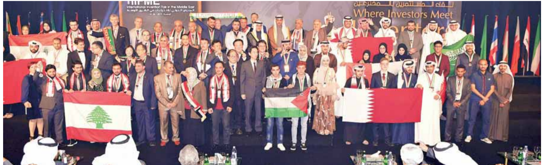
العبدالله والخرافي في صورة جماعية مع الفائزين