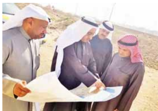
الجمعة يطلع على مخطط المنطقة