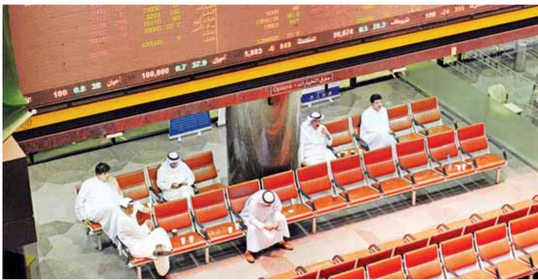
إعلان التحالف الفائز بمزايمة البورصة بعد أسبوعين

نفسه، علماً أنه لا يوجد ما يمنع أن تقوم بدور المشغل فقط وتملك حصة ولو بواقع سهم واحد. وقالت المصادر إن كلا التحالفين المتنافسين قادر على إحداث نقلة نوعية في السوق.