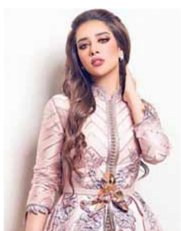
بلقيس أحمد فتحي

تحبي الفنانة بلقيس أحمد فتحي مساء اليوم حفلاً غنائياً في مدينة الملك عبدالله الاقتصادية في السعودية، يأتي الحفل ضمن الفعاليات المصاحبة للبطولة السعودية الدولية لمحترفي الغولف، وبمشاركة النجم العالمي شون بول إلى جانب عدد من الفنانين العالميين. وقد طلبت بلقيس من جمهورها عبر وسائل التواصل الاجتماعي، اختيار الأغنيات التي يفضلونها في الحفل العالمي، لتضعها ضمن برنامجها الغنائي في الحفل، معربة عن سعادتها لاختيارها ضمن النجوم العالميين في هذه الاحتفالية الكبيرة.