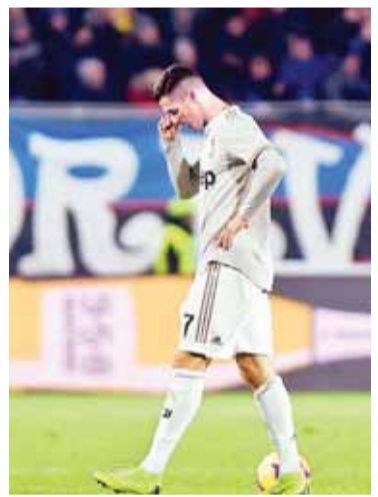
رونالدو خائب بعد الخسارة الثقيلة

ويلتقي اتالانتا برغامو، المتوج باللقب مرة واحدة عام 1963، مع فيورنتينا في الدور نصف النهائي، وهما لحقا ميلان، حامل اللقب 5 مرات، آخرها عام 2003، الذي كان