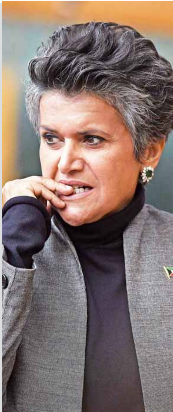
صفاء الهاشم.. في لحظة حذر

رفض المجلس رفع الحصانة عنهما بعد موافقة 4 نواب فقط من أصل 33 نائباً.