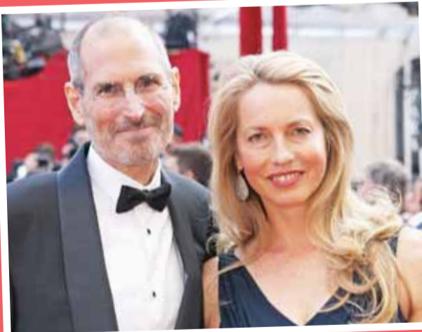
لورين مع زوجها الراحل ستيف جوبز