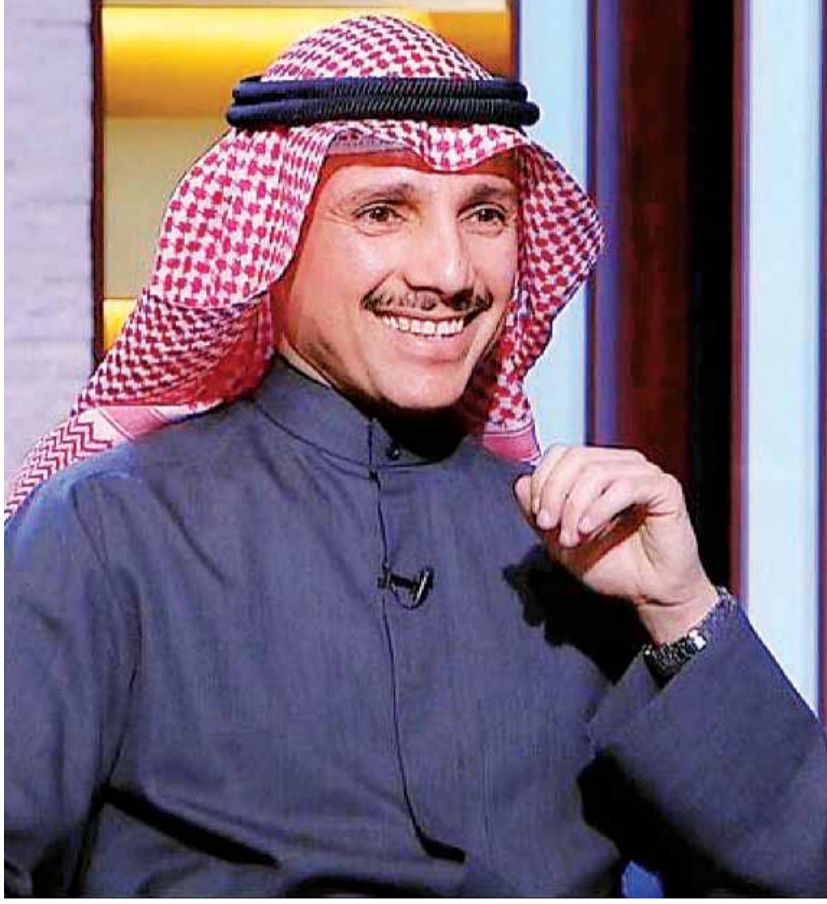
الغانم خلال لقائه التلفزيوني