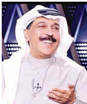
الرويشد في برنامج «ليالي الكويت»

عبدالله الرويشد تحدث عن الجديد الذي يستعد لتقديمه للجمهور محتفظاً ببعض المفاجآت لتابعيه، حيث تحدث عن التجهيزات لمجموعة اغانيه القادمة وسط تفاعل كبير من المشاهدين، الذين اثنوا على أداء الرويشد وأحاساسه الفني المرهف، حيث أوضح أن المفردة التي كانت تغني في السابق من المفردات الثقيلة من حيث الوزن اللغوي،