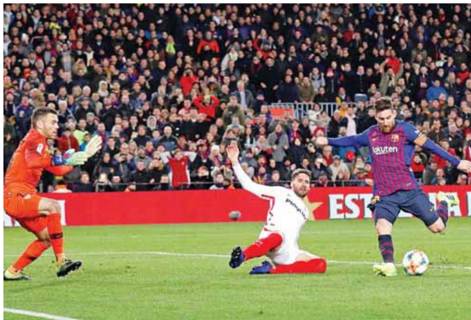
ميسي مسجداً الكرة على مرمرى إشبيلية

فيليببي كوتينييو من ركلة جزاء، والكرواتي إيفان راكيتش في الدقيقتين 13 و31 من زمن اللقاء. وفي الشوط الثاني، زاد برشلونة من غلته بهدفين عبر كوتينييو وسيرجي روبيرتو في الدقيقتين 53 و54 من زمن المباراة. وعاد إشبيلية ليقلص الفارق بهدف عبر البرازيلي غويلهيرم أرانا في الدقيقة 68 من زمن اللقاء. ورغم ذلك، عاد برشلونة لإضافة الهدفين الخامس والسادس عبر الأوروغوياني لويس سواريز والأرجنتيني ليونيل ميسي في الدقيقتين 89 و90 من زمن المباراة. (مدريد - أ.ف.ب)