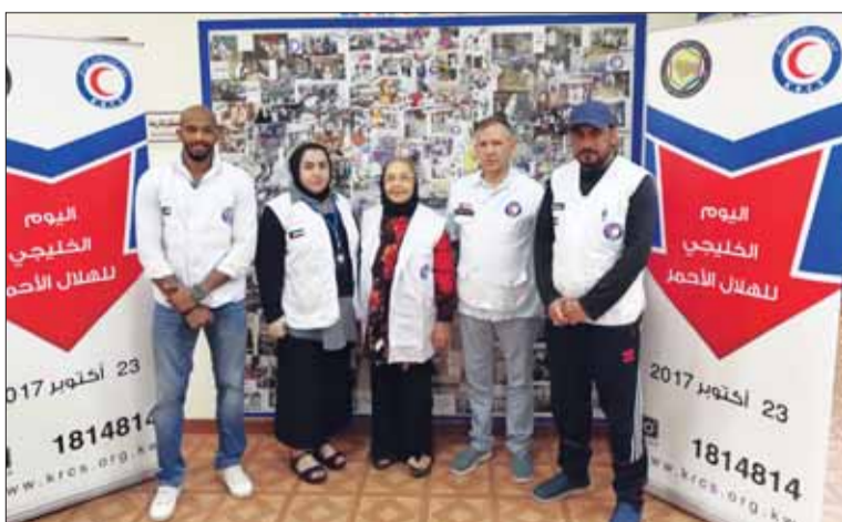
• متطوعو جمعيات الهدال الأحمر الخليجي

من جهة ثانية، واصلت الكويت تقديم المساعدات الإنسانية الأساسية إلى مسلمي الروهينغا في بنغلادش. ووزعت جمعية الهدال الأحمر الكويتي 600 طرد غذائي إضافة إلى 600 طرد تحوي وسائل تنظيف في مخيم شكمربيل. وفي مخيم بلو خلي وزعت الجمعية 500 طرد تحوي أدوات مطبخية و500 طرد غير غذائي تحوي احتياجات المنزل. وتنتشر فرق الجمعية في منطقة كوكس بازار في بنغلادش التي تضم 16 مخيماً للاجئين الروهينغا. (كونا)