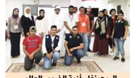
«الروهينغا.. أزمة الضمير العالمي» لرابطة الشباب الكويتي