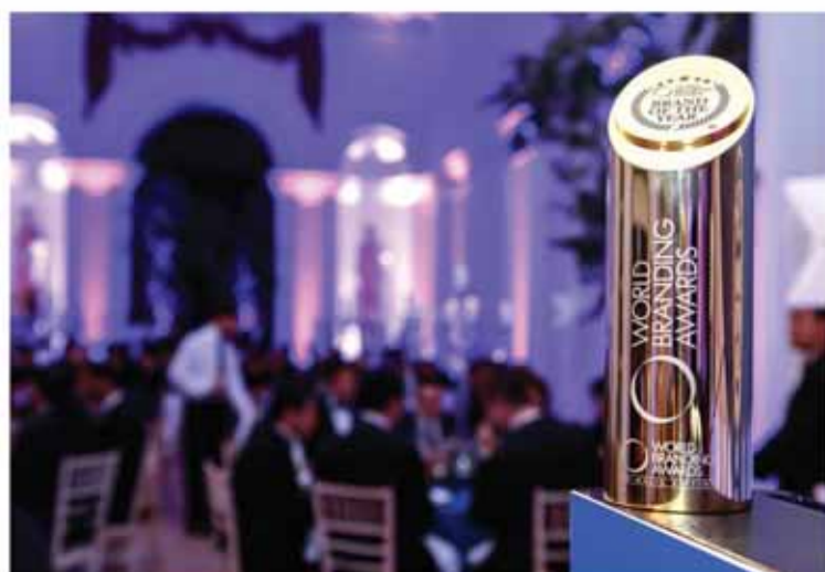
• جائزة أفضل علامة تجارية في العالم وجانب من الحضور.

خلال مراسم الحفل السنوي الذي أقيم في قصر كينزكتون في العاصمة البريطانية لندن تم توزيع جوائز أفضل العلامات التجارية العالمية في مختلف المجالات حسب إنجازاتها المميزة في السوق العالمي، وتم تنظيم الحفل وتسليم الجوائز من قبل منتدي العلامات التجارية العالمية، وهي منظمة عالمية غير ربحية مسجلة مقرها في لندن . وتم منح الجوائز إلى عدد من الشركات من بينهم ( أبل، بي ام دبليو، المجلس الثقافي البريطاني، كارتية، الجزيرة للعطور، رولكس، لويس فويتون، كوكا كولا، الفيسبوك، جوجل، ليغو، لوريال، ماك دونالدز، نسكافيه، ناكي،