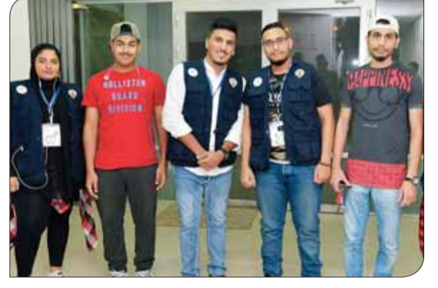
• فريق نوايا إنسانية