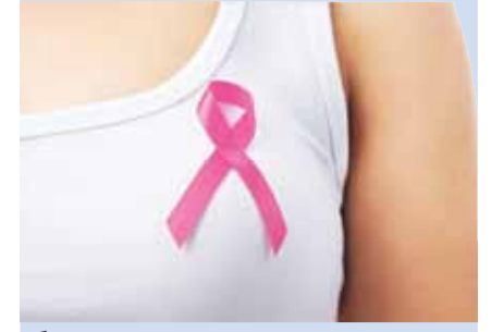
شهر التوعية بالسرطان ما زال مستمراً