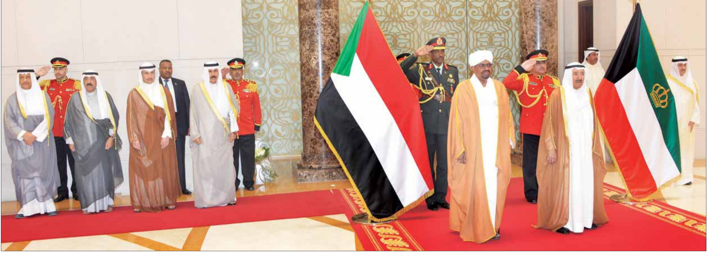
• الأمير مستقبلاً البشير في المطار.. وبدا ولي العهد والغانم ومشعل الأحمد والمبارك

استقبل سمو أمير البلاد في قصر بيان صباح أمس، سمو ولي العهد الشيخ نواف الأحمد، ورئيس مجلس الأمة مرزوق الغانم، ورئيس مجلس الوزراء سمو الشيخ جابر المبارك، والنائب الأول لرئيس مجلس الوزراء وزير الخارجية الشيخ صباح الخالد. (كونا)