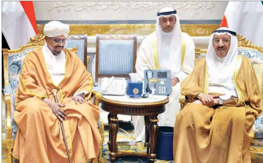
• جانب من المباحثات الرسمية

اجتمع الرئيس السوداني عمر البشير في مقر إقامته بقصر بيان أمس مع رئيس مجلس الأمة مرزوق الغانم، ورئيس الوزراء سمو الشيخ جابر المبارك، والنائب الأول لرئيس مجلس الوزراء وزير الخارجية الشيخ صباح الخالد.