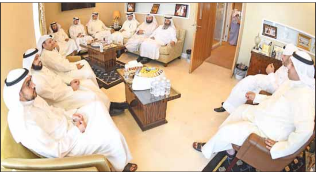
• النواب في اجتماع مكتب البابطين

تسرون بنفس الدرب في دور الانقاذ الأول فلن يكون تعاون وعدم التعاون سيكون من قبل الحكومة». وقال: «ويشأن قانون الرياضة الذي عرض يوم الخميس الماضي في الاجتماع الذي كان يفترض أن يكون آخر اجتماع للجنة، وفجأة ظهر لنا قانون وهو مشروع حكومي ونقول ان الفيفا قدمت لها رسالة تذكر فيها وجوب التعديل على القانون وهو ما يحقق شرطاً من شروط رفع الإيقاف، وسؤالني: أين كتاب الفيفا لماذا لم يعرض؟ ونحن عندما خاطبنا الفيفا بشكل رسمي كان بشأن اقتراح بقانون من قبل النواب تقدمت به شخصياً، فمن الذي أرسل مشروع الحكومة للفيفا؟».