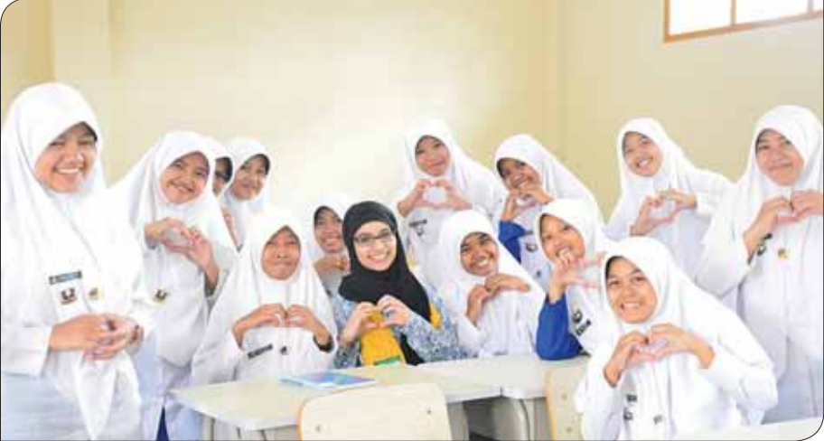
• هيا المسباح في مدرسة الدارين - اندونيسيا