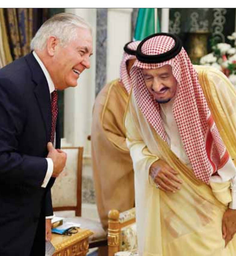
خادم الحرمين وتيلرسون يتحدثان قبل اللقاء بينهما في الرياض أمس

دعا وزير الخارجية الأمريكي ريكس تيلرسون في الرياض أمس «الميليشيات الإيرانية» إلى مغادرة العراق مع اقتراب حسم المعركة مع تنظيم داعش، في دعوة تعكس سعي الولايات المتحدة الحثيث إلى الحد من نفوذ طهران في الشرق الأوسط. وجاءت الدعوة خلال مؤتمر صحفي مع نظيره السعودي عادل الجبير في ختام زيارة للرياض. وقال تيلرسون: «بالطبع هناك ميليشيات إيرانية. الآن، بما أن المعركة ضد «داعش» شارفت على نهايتها، فإن على تلك الميليشيات العودة إلى موطنها. على جميع المقاتلين الأجانب العودة إلى مواطنهم». وطالب وزير الخارجية الأمريكي - أيضاً - الدول والشركات الأوروبية التي تقيم «علاقات تجارية مع الحرس الثوري الإيراني» بوقف هذه الأعمال، معتبراً أن هذه الدول والشركات «تواجه مخاطر كبيرة». وقبل دعوته هذه، شارك تيلرسون في الاجتماع الأول لمجلس التنسيق السعودي - العراقي، الذي تاتي ولادته تنويجاً لتقارب سعودي - عراقي سياسي ودبلوماسي واقتصادي، بدأ قبل أشهر بعد قطعية دامت نحو 27 عاماً. وراى تيلرسون أن إنشاء المجلس «سيفتح صفحة جديدة في المنطقة، وإعادة العلاقات بين الرياض وبغداد أمر مهم لبناء عراق قوي، بعيداً عن تأثير إيران». والنقى تيلرسون - قبل أن يتوجه إلى الدوحة - العاهل السعودي الملك سلمان بن عبد العزيز وولي العهد الأمير محمد بن سلمان؛ لمناقشة الأزمة الخليجية. وعبر الوزير الأمريكي عن أمله في «دخول جميع الأطراف الخليجية في حوار لحل الأزمة» وإعادة وحدة مجلس التعاون الخليجي؛ لأنه «منظمة قوية تسهم في تحقيق الاستقرار بالمنطقة».