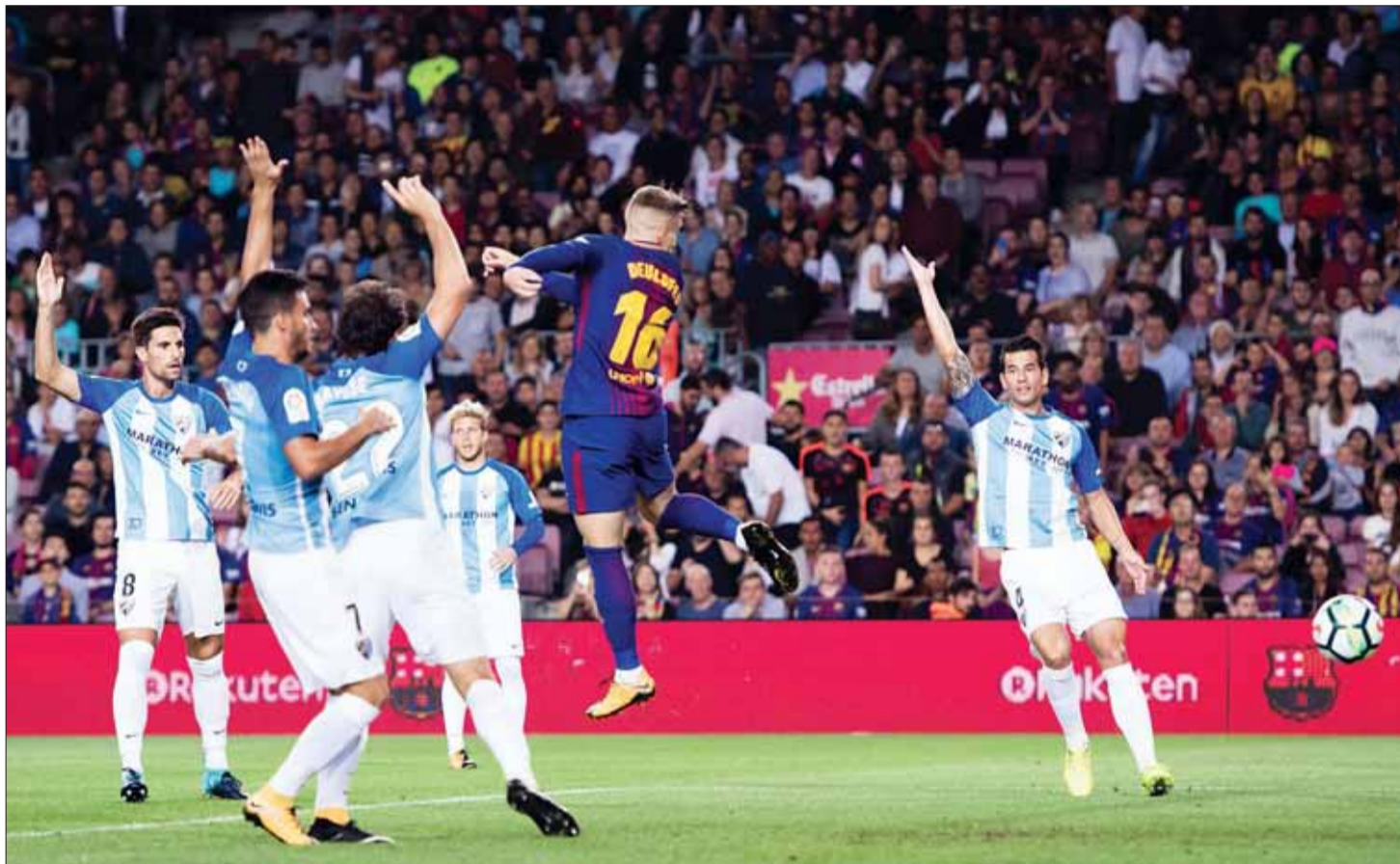
جيرار ديلوفيو يسجل بـ «الكعب» وسط اعتراض لاعبي ملقا

دخل الصاعد جادون سانشو التاريخ في نادي بوروسيا دورتموند الألماني بعدما أصبح أول لاعب إنكليزي في تاريخ النادي. وشارك سانشو كبديل خلال المباراة التي تعادل فيها دورتموند مع مضيفه اينتراخت فرانكفورت 2 - 2 السبت. وانضم سانشو (17 عاماً) إلى دورتموند قادماً من مانشستر سيتي الإنكليزي الصيف الماضي. وكاد سانشو أن يخطف هدف الفوز لدورتموند قبل سبع دقائق من النهاية، ولكن لوكاس هارديكي حارس فرانكفورت حرمه من التسجيل. من جانب آخر، أعلنت إدارة دورتموند رحيل الحارس رومان فايند فيلر، عن صفوف الفريق بنهاية الموسم الحالي. وانضم رومان فايند فيلر (37 عاماً) لصفوف أسود فيسيفال عام 2002، لكنه فقد مركزه الأساسي مع الفريق الألماني، لمصلحة رومان يوركي الذي انضم للفريق عام 2015. وقال مايكل زورك، المدير الرياضي لبوروسيا دورتموند، خلال تصريحاته لشبكة سكاي سبورتس «من المؤكد أن رومان فايند فيلر يقضي حالياً عامه الأخير معنا، ويمكننا القول أننا نبحث عن الحارس البديل». (د ب أ)