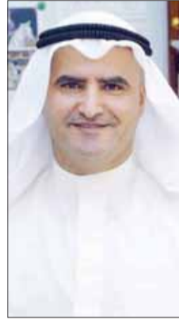
• عصام المرزوق

إحدى قاطنات منطقة حطين توجه نداء عاجلاً لوزير النفط وزير الكهرباء والماء المهندس عصام المرزوق حول عملية ترتيب وتنظيم الكيبلات المتعلقة ببعض منازل المنطقة والمترامية في موقع معين وقريب من سطح الأرض ومنزلها - حسب قولها - الأمر الذي تسبب في حريق لمحطة الكهرباء التي تقع بجوار منزلها وتهدد منزلها وحياة أسرته!