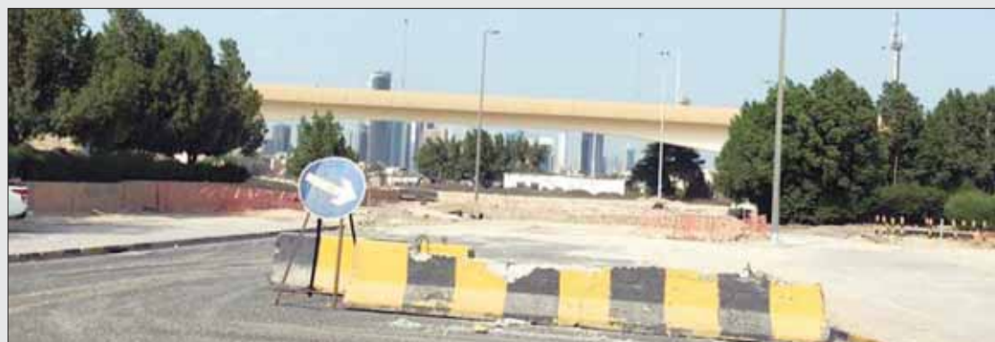
• الحواجز ما زالت موجودة

نحن أهالي كيفان قطعة 3، كنا متعاونين طوال السنوات الماضية مع وزارة الأشغال في تنفيذ مشروع الدائري الثاني الذي يفصل منازلنا عن منطقة الشامية، حيث تم تحويل الطريق الواقع أمام منازلنا ليكون تحويله من داخل كيفان إلى الدائري الثاني وبتجاه واحد فقط، وكنا نضطر للالتفاف بين الشوارع من أجل الذهاب إلى فرع الجمعية أو المستوصف لأن الاتجاه جيري باتجاه واحد، والآن بعد أن تم الأمر وتحويل المشروع إلى مكان آخر، وتم افتتاح الطريق المؤدي إلى داخل منطقة كيفان، ما زالت الحواجز