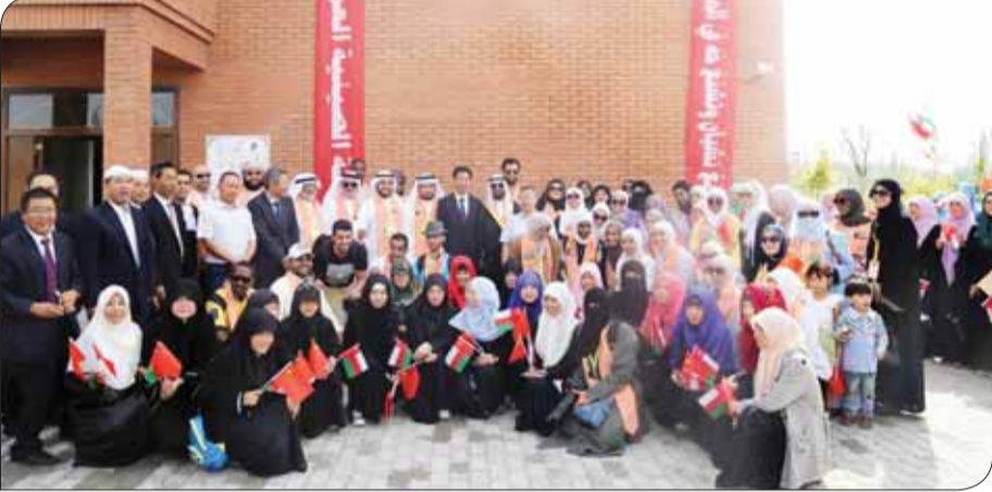
• معهد الدارين بنات في الصين