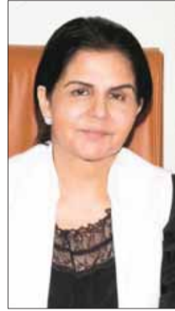
• شفيقة العوضي

أنا مواطن وأب لابنة معاقة شديدة ودائمة، ناشد مديرة الهيئة العامة لشؤون ذوي الإعاقة شفيقة العوضي العمل على تسليم ابنتي كرسي متحرك، الذي أراجع الهيئة من أجله منذ سنتين، فالعام الماضي لم يتم استقبال الحالات بحجة وجود تنظيم جديد للتوزيع، وتم توزيع كرسي متحرك واحد لأحدى الحالات التي انتشرت في وسائل التواصل الاجتماعي وهي تستحق بلا شك، علماً بأن ابنتي تسلمت كرسيها متحركاً منذ أكثر من 5 سنوات والأبن البنات كبرت وأصبح الكرسي صغيراً على جسمها، حيث تجلس على الكرسي بطريقة خاطئة ويسبب لها انحناءات بالظهر، علماً بأن الكرسي المتحرك هو الوسيلة الوحيدة لها للتنقل بسبب إعاقته الشديدة والدائمة، لذا أتمنى من المديرة العامة للهيئة العامة لشؤون ذوي الإعاقة الالتفات لمناديتي هذه وجزاكم الله خيراً.