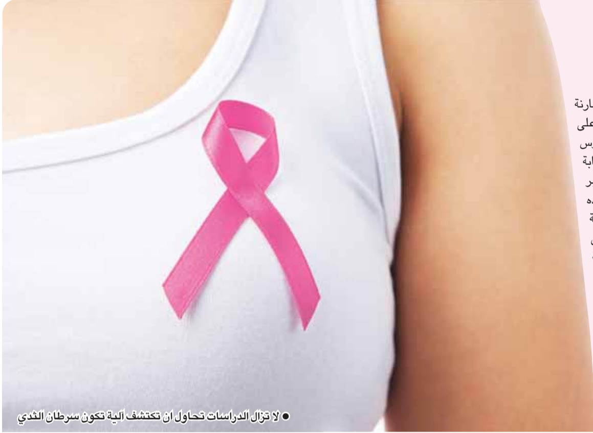
● لا تزال الدراسات تحاول أن تكتشف آلية تكون سرطان الثدي

ومن جانب آخر، علق د. ستيفن غروبيمر، مدير قسم جراحة الأورام في كليفلاند كلينيك قائلاً «إننا تمكنا من استهداف بكتيريا ما قبل السرطان، فيمكننا أن نجعل البيئة النسيجية أقل ترحيباً بالسرطان، أو بمعنى آخر خائفة ونافرة للسرطان أو يمكن استخدام ذلك لتحسين جودة العلاج».