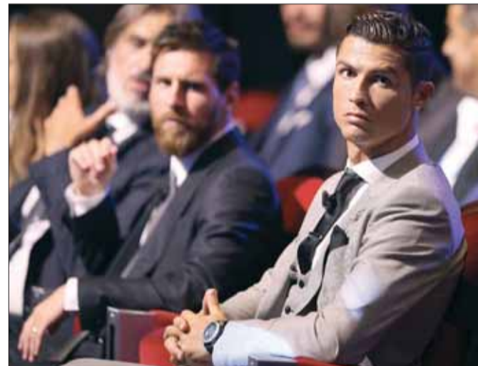
رونالدو أقرب من ميسي لجائزة «لاعب العام 2017»

اما ميسي (30 عاماً) فسجل 54 هدفاً لبرشلونة الموسم الماضي وقاده إلى إحراز الكأس المحلية، كما استهل الموسم الحالي بطريقة رائعة بتسجيله 12 هدفاً في أول 8 مباريات في مختلف المسابقات لفريقه.