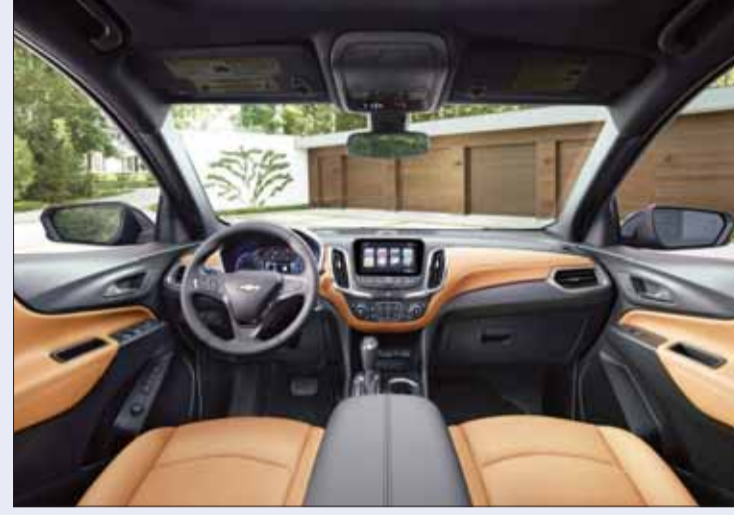
• التابلوه والكونسول الوسطي

قدمت شيفروليه الغانم سيارتها الجديدة بالكامل شيفروليه أكويونوكس 2018 لتتنضم إلى أغنى مجموعة سيارات من شيفروليه. سيكون هذا الإطلاق الأول لسيارة أكويونوكس في المنطقة بعد أن حققت هذه السيارة نجاحاً كبيراً في الأسواق العالمية منذ طرحها لأول مرة في عام 2005. وتوفر شيفروليه أكويونوكس 2018 للعملاء توازناً مثالياً بين الأداء والكفاءة والميزات.