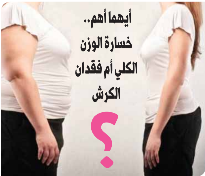
● المرأة السمنة أكثر عرضة للإصابة بسرطان الثدي

بعدة أمراض مثل امراض القلب والسكري وسرطان القولون. فقد تساءل عدة باحثين إن كان الأمر ذاته ينطبق أيضاً على سرطان الثدي. وفي الدراسة التي نشرتها مجلة السرطان المرتبط بالغدد الصماء، أشار الباحثون إلى أن خسارة دهون الجسم الكلية له دور في خفض احتمال الإصابة بسرطان الثدي، بينما قل تأثير انخفاض كمية دهون الكرش. فبعد تتبع خسارة السيدات للوزن الكلي من خلال التحاليل المخبرية وأشعة الرنين المغناطيسي وجد الباحثون أن خسارة دهون الجسم الكلي كان له أثر كبير في إتران معدل الهرمونات المؤثرة في هذا السرطان وبشكل يفوق تأثير دهون الكرش. حيث وجد أن خسارة وزن الجسم تسبب إتران تركيز كل من الاستروجين والتستوستيرون والليبتين والمركبات الالتهابية في الجسم. بينما اقتربت خسارة دهون الكرش مع انخفاض تركيز المركبات الالتهابية فقط. وعليه، أكد الباحثون أهمية خسارة الوزن لتحسين البيئة الكيميائية في الجسم المحاربة أو المقاومة لسرطان الثدي.