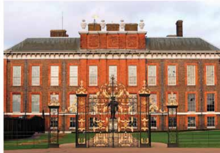
• قصر كينزكتون.