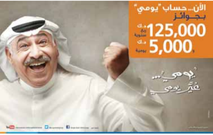
• ملصق الحملة