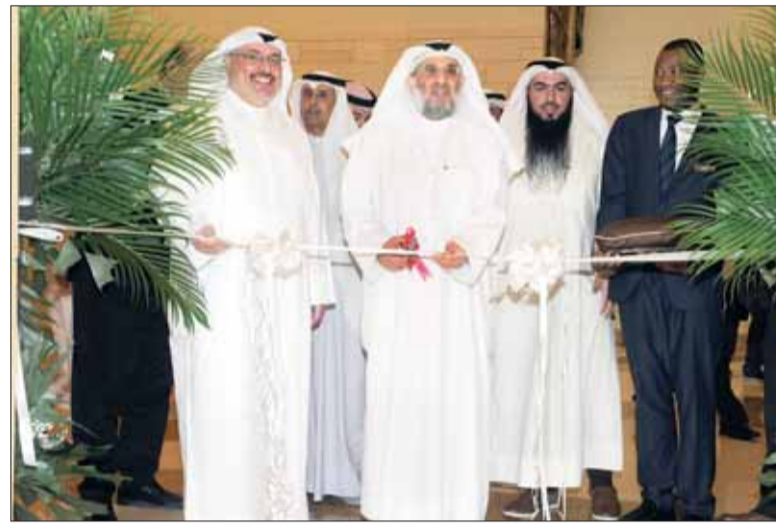
• مؤتمر الجسور والبنية التحتية برعاية وزير الأشغال خالد الحطاب

وعن نسب إنجاز طريق جمال عبدالناصر لفت إلى أنها بلغت 86 في المئة، وتتضمن تشييد الجسور والمنحدرات من سلسلة من أعمال التحويل والنقل والحماية والتحديث للمرافق والخدمات، ما سيعيد تطويراً ضخماً للبنية التحتية في البلاد، في حين بلغت في طريق الجبراء 94 في المئة.