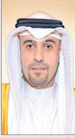
• أنس الصالح

بعد أن تم تطبيق نظام البصمة في وزارات ومؤسسات الدولة، اعتباراً من الأول من الشهر الجاري، برزت على السطح الكثير من الأقاويل والملاحظات والمقترحات والمشاكل التي واجهها بعض الموظفين. نحن كعادتنا في «الباب المفتوح» نتفاعل مع هكذا أمور تمس شريحة كبيرة ونجد أنه من الأهمية بمكان إفساح المجال لاختونا القراء الكرام الإذلاء بدلوهم وملاحظاتهم وحلولهم المتعلقة بنظام البصمة. وعمّا إذا كانت هناك أية ملاحظات نتمكن من نقلها إلى جهات العلاقة والاختصاص بديوان الخدمة حتى يتم إيجاد الحلول المناسبة، ونحن بدورنا نأمل من شخص الأخ نائب رئيس مجلس الوزراء وزير المالية ورئيس مجلس الخدمة المدنية أنس الصالح والمعنيين بالأمر في ديوان الخدمة، التعاون والتجاوب لإيجاد الحلول والإجابات المناسبة للأسئلة والاستفسارات التي ستجد طريقها للنشر اعتباراً من العدد المقبل والأعداد اللاحقة، ونحن بانتظار اهتمام السادة القراء المعنيين وتجاوبهم، ويمكنكم التواصل معنا من خلال الفاكس رقم 24838884 أو بواسطة الإيميل الخاص بجريدة إقبس.