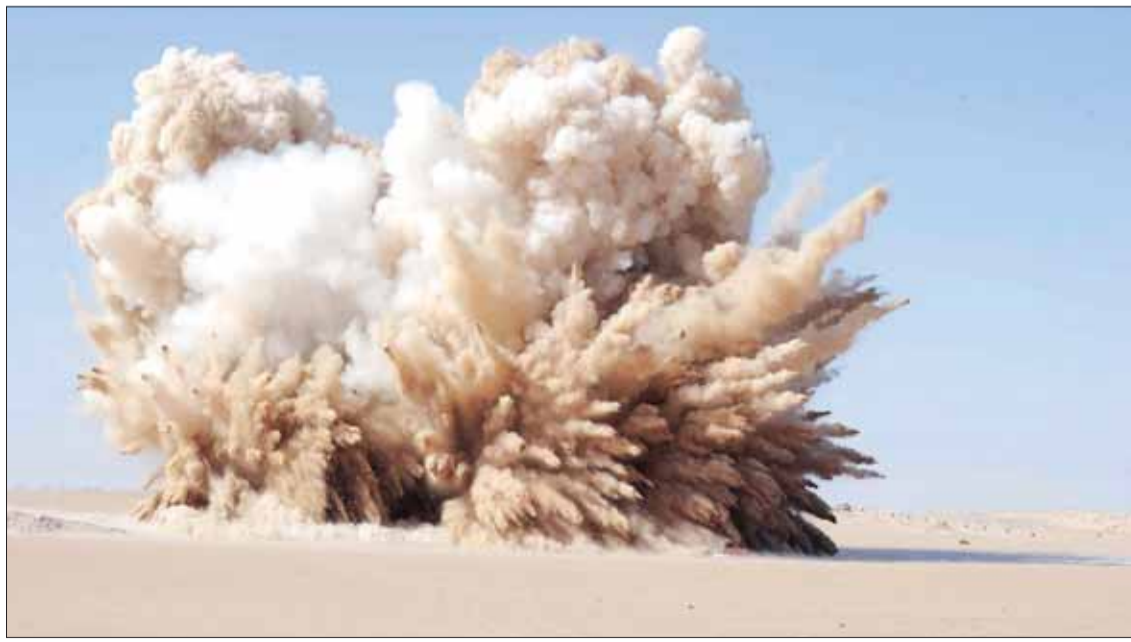
• تفجير أراضي المطلاع لتفتيت التربة

وأشار إلى أن التطبيق الجديد يتميز بسهولة الاستخدام وامكانية اظهار الإحصاءات بأكثر من صورة سواء كانت على شكل رسم بياني أو جداول إحصائية أو سلاسل زمنية، إضافة إلى أنه قد تمت إتاحة هذه البيانات الإحصائية ومتغيراتها المختلفة على شكل خرائط تفاعلية تسمح للمستخدم بجراء تحاليل متخصصة فضلاً عن توفير التطبيق التقارير الإحصائية والمؤشرات المختلفة بشكل لامت استخدامها بشكل بسيط باستخدام تنزيلها واستخدامها بواسطة البرامج المختلفة الموجودة على أجهزة الكمبيوتر.