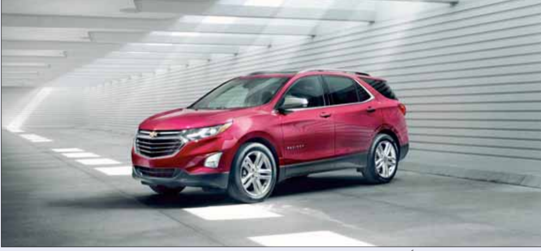
• شيفروليه أكويونوكس الجديدة كلياً وصلت الكويت