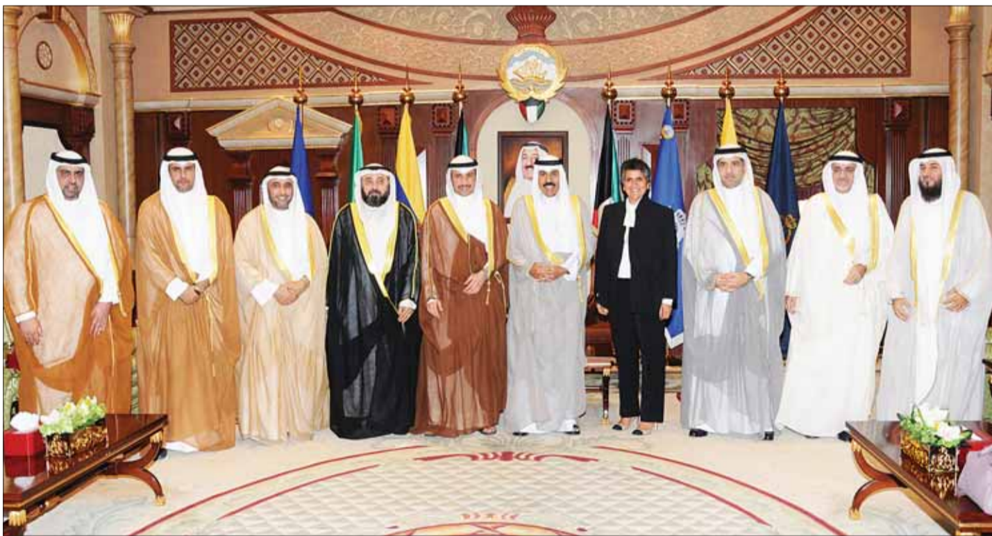
• ولي العهد مع الغانم وأعضاء الوفد البرلماني

وكان سمو ولي العهد الشيخ نواف الأحمد قد استقبل في قصر بيان صباح أمس، رئيس مجلس الأمة مرزوق الغانم، وأعضاء الشعبة البرلمانية المشاركين في الجمعية العامة الـ137 للاتحاد البرلماني الدولي، الذي عقد في مدينة سانت بطرسبرغ بروسيا الاتحادية. كما استقبل سموه رئيس مجلس الوزراء سمو الشيخ جابر المبارك. (كونا)