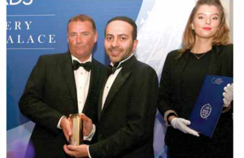
• مدير عام شركة الجزيرة للعطور يستلم الجائزة.