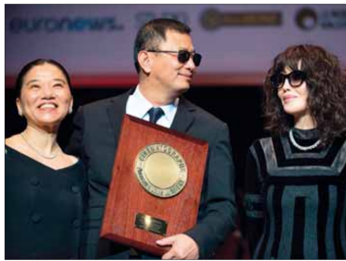
• أدجاني تسلم المخرج كار واي الجائزة وتبدو زوجته في الصورة

قامت النجمة الفرنسية إيزابيل أدجاني بتكريم المخرج الصيني وونغ كار واي، وتسليمه جائزة «لوميير» السينمائية على مجمل مسيرته الفنية، وذلك في افتتاح الدورة التاسعة من مهرجان لوميير السينمائي المقام حالياً في ليون بفرنسا.