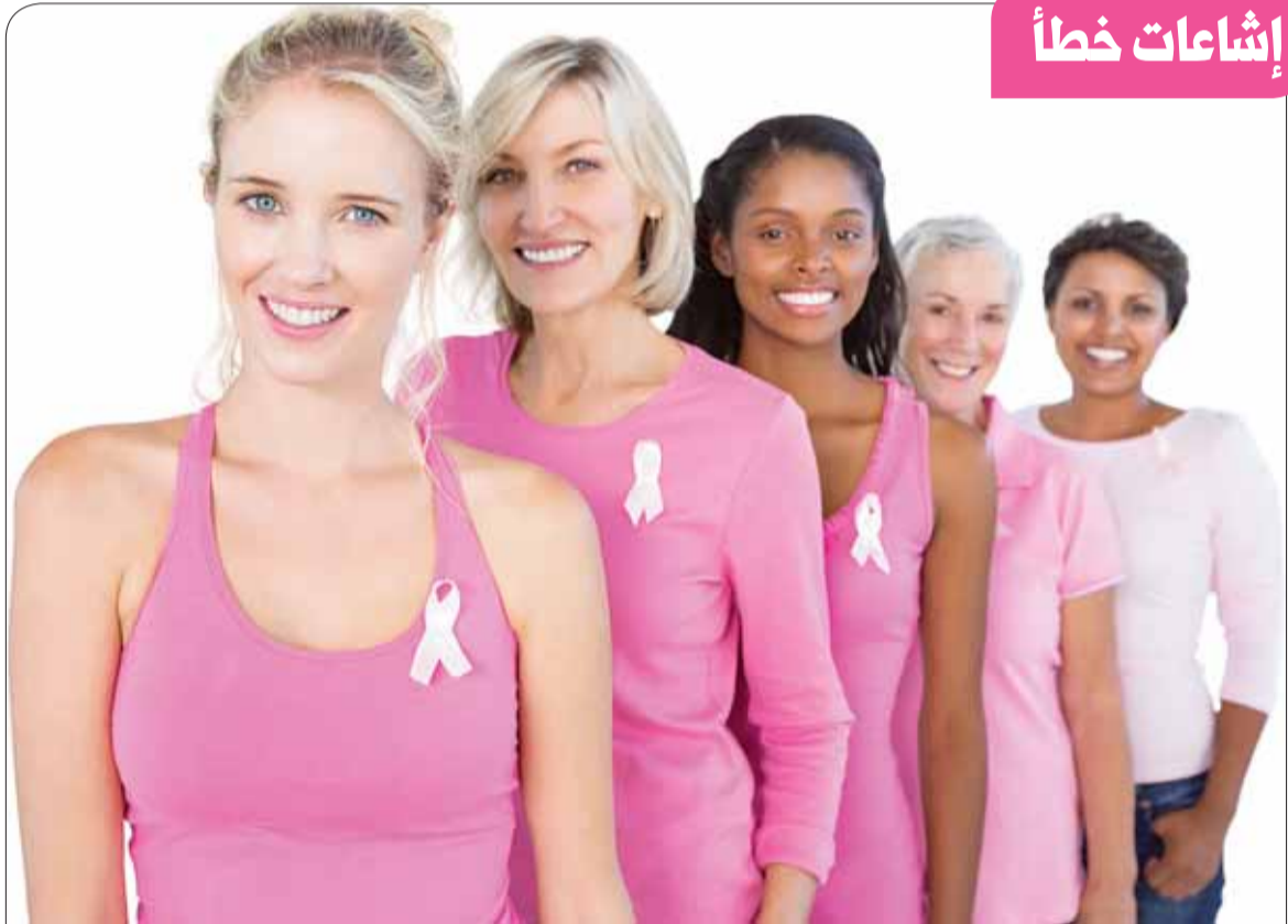
● جميع السيدات عرضة للإصابة بسرطان الثدي ولكن يمكنهن خفض هذا الاحتمال

1 الإشعاع: معظم الحالات التي تصاب بسرطان الثدي سببها وراثي!