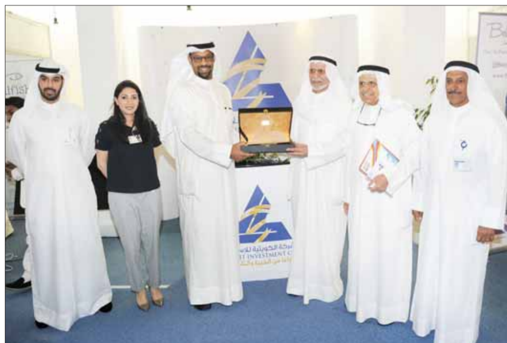
• جناح «الكويتية للاستثمار» في المعرض

أعلنت الشركة الكويتية للاستثمار عن مشاركتها في رعاية معرض «المشروعات الصغيرة والحرفية»، الذي أقيم بمقر غرفة تجارة وصناعة الكويت بالتعاون مع وزارة الدولة لشؤون الشباب وذلك خلال الفترة من 16 إلى 18 الجاري.