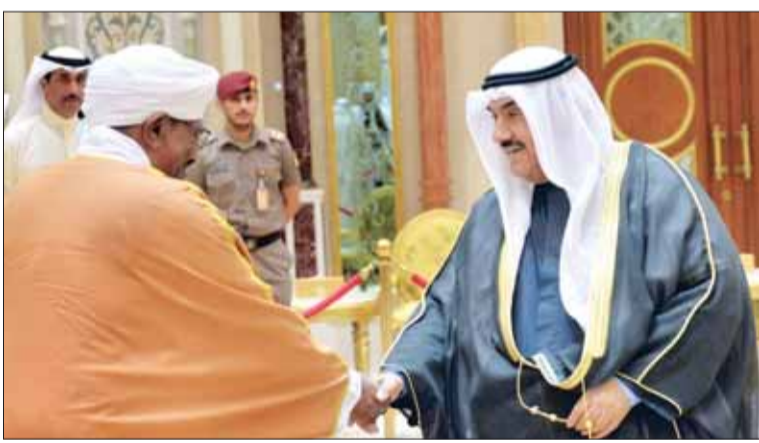
•.. وناصر المحمد

وحضر المباحثات رئيس مجلس الوزراء سمو الشيخ جابر المبارك، والنائب الأول لرئيس مجلس الوزراء وزير الخارجية الشيخ صباح الخالد، وكبار المسؤولين في الدولة. وذكر نائب وزير شؤون الديوان الأميري، الشيخ علي الجراح، بأن المباحثات تناولت استعراض العلاقات الثنائية بين البلدين والشعبين الشقيقين، وسبل تعزيزها وتنميتها في المجالات كافة بما يحقق تطلعاتهما، وتوسيع أطر التعاون بين الكويت والسودان بما يخدم مصالحهما المشتركة، كما تم بحث القضايا ذات الاهتمام المشترك. وكان الرئيس السوداني عمر البشير