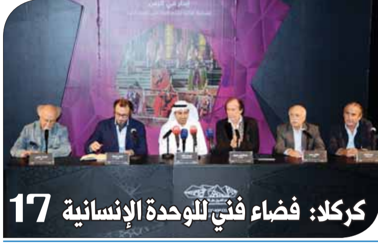
17 كركلا: فضاء فني للوحدة الإنسانية