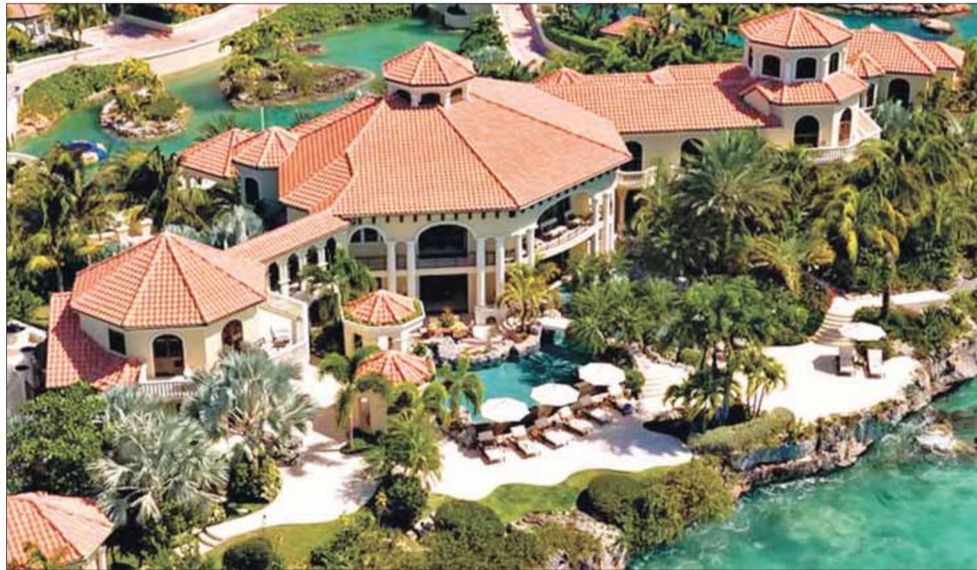
• هناك فرص الآن.. ولكن!

زيادة أسعار العقارات الجاهزة في 5 سنوات مقابل 200% للأراضي